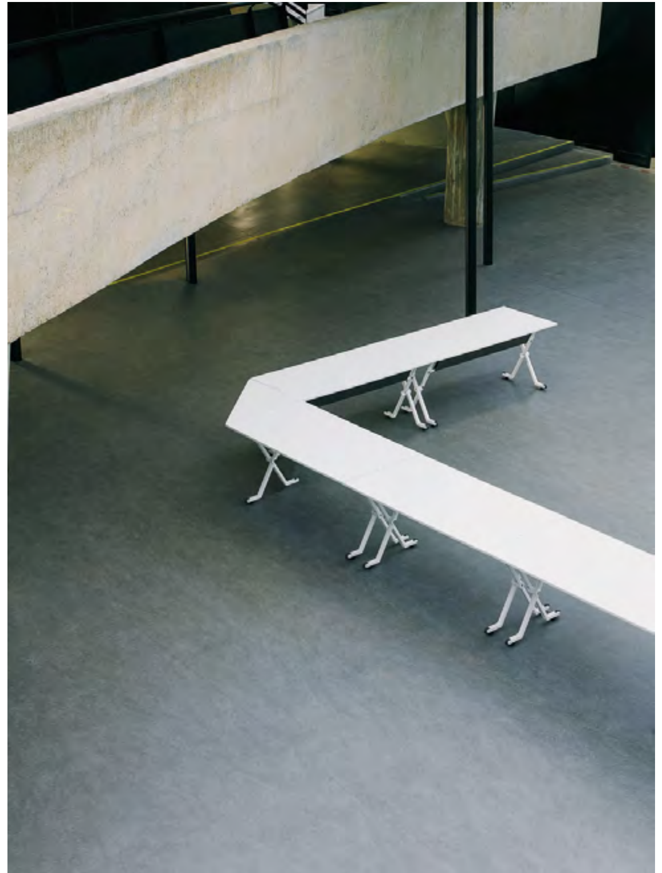
Folio table (ref. 6010) with a RAL 9016 lacquered structure and top in White melamine with front panel (ref. 6007) upholstered in Urban YN086.