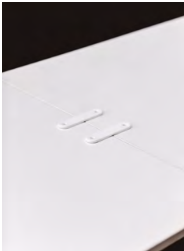
Table connectors in RAL 9016 polypropylene.

Its flexibility and manageability means anybody can fold and move the Folio tables easily with one hand, stack them in the desired place of storage, or transport them easily on the optional trolley. The outcome is huge savings in assembly, disassembly and storage. It also come with its own transport trolley and other accessories.