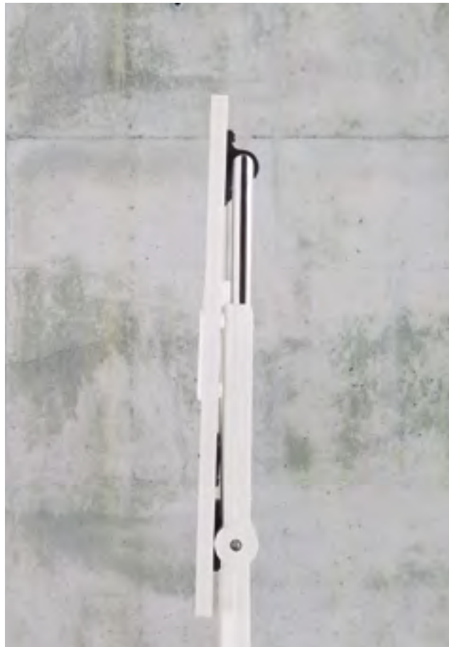
Folio table (ref. 6010) with a RAL 9016 lacquered structure and top in White melamine.