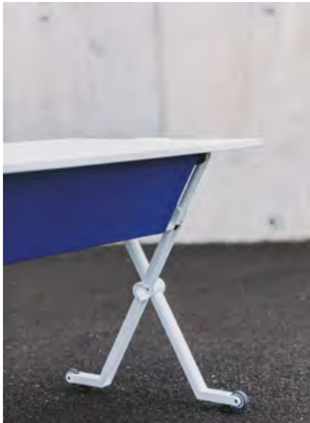
Folio table (ref. 6002) with RAL 9016 lacquered structure and top in White laminate, used with Folio panel (ref. 6007) upholstered in Xtreme Plus YS035.